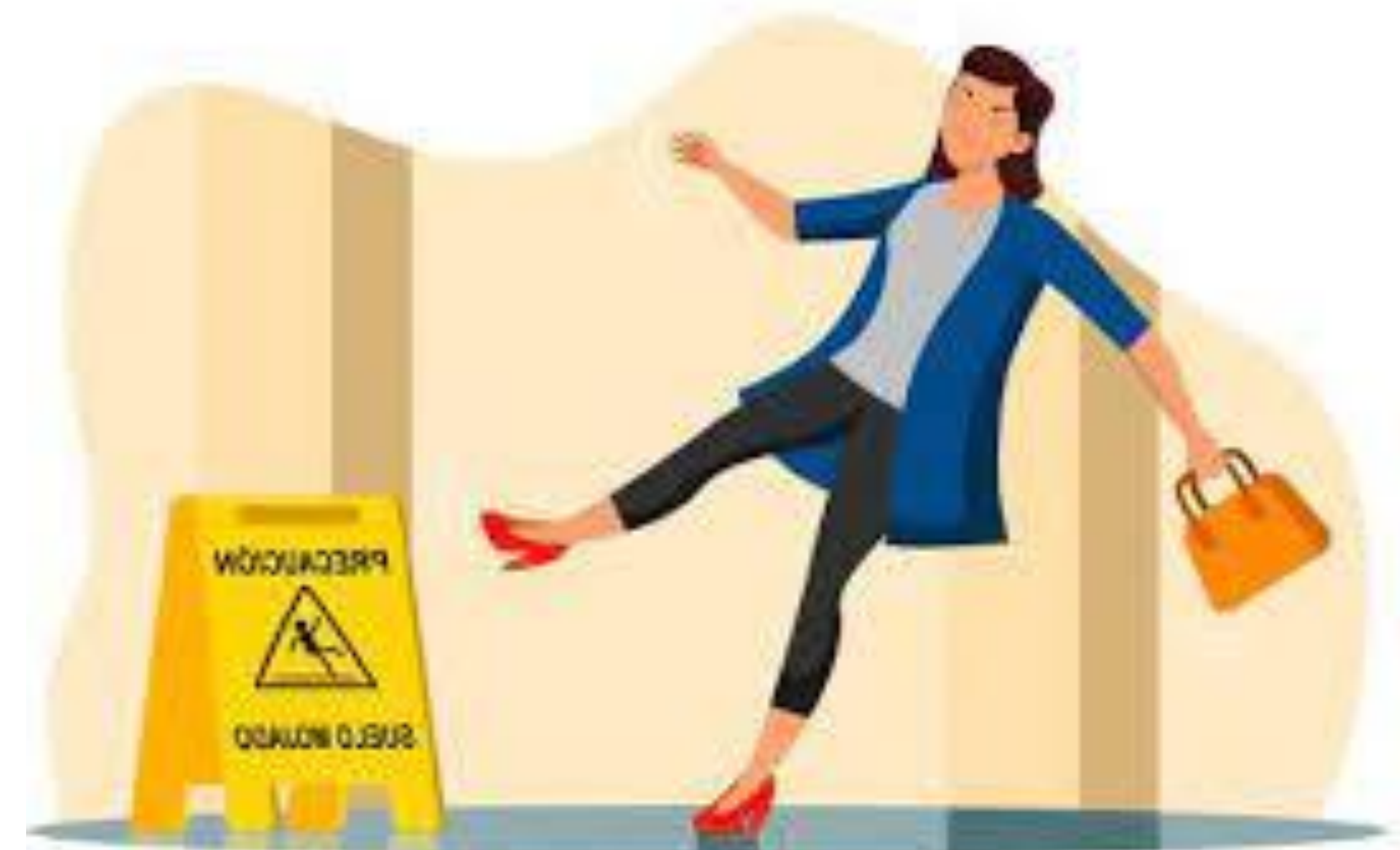
Ilustración de https://www.freepik.es/