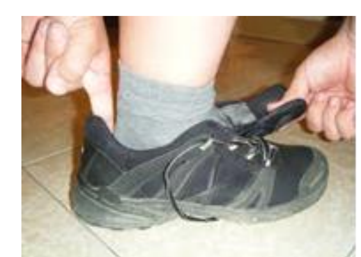
Descripción de imagen